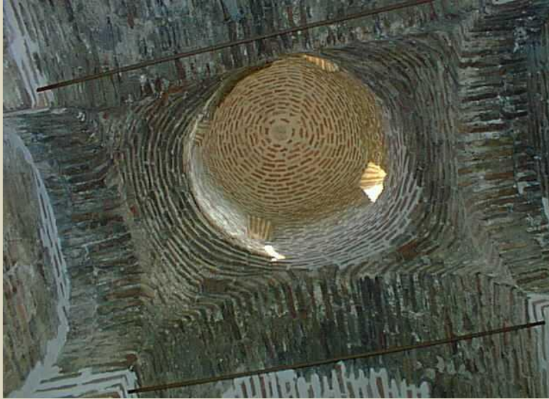
MANASTIR SVETI JOVAN KRSTITELJ